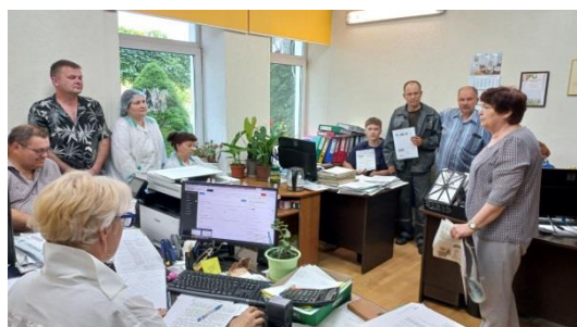
Главный врач УЗ «Шкловский райЦГЭ»

Проведение такой работы с населением- это не только информационная поддержка, но и старт для сохранения и укрепления здоровья нации, шаг к жизни без табака.